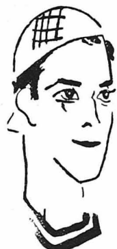
'Ο Ραμόν Νοβάρο (Τελευταίο σκίτο)