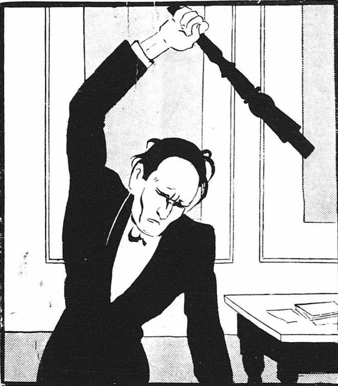
Πέταξε τὸ πόδι τοῦ τραπέζιου μ' ὀργὴν στὸ πάτωμα!...