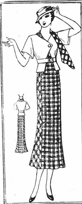
Χαριτωμένο ανόσμιπλ, από δύο ύφάσματα, απλό και παντριγιέ.