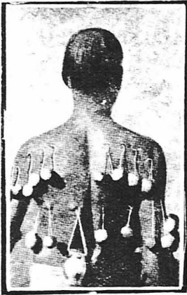
Ίνδος «μάστος» που έχει τροπημένη την πλάτη του με αγκίστρια, απ' τα οποία κρέμονται βάρη.

Πώς εξηγούνται οι θαυμάσιες της θεάς Δραπάνδη. Το μαρτύριο της πυράς. Περπατούν άπλωμα σ' αναμμένα κάρβουνα! Τα ανατριχιαστικά βασανιστήρια του «Τάι Πουζάμ». Οι τραγικοί «μαρτυρες» και τα θαύματά τους, κλπ. κλπ.