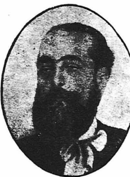
Ο Άνδρέας Πεταλάς

Η προαισθήσις κι' ο πόθος συγχρόνως του Πεταλά να πεθάνη ξαρκια, επραγματοποιήθηκε. Πέθανε αφινιδίως στις 8 του Άπριλίου του 1903.