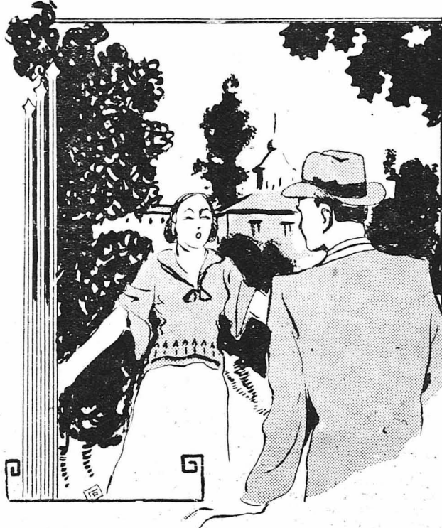
'Αμέσως ή Ματρένα έτρεξε λαχανιασμένη κοντά του...

...'Ο Βόρις ή ο Μιχαήλ;... 'Α! πόσο δυστυχισμένη είμαι!... Γιατί δεν με σκοτώνουν έμένα; Φοβέη!... Νά θέλουν να σκοτώ-