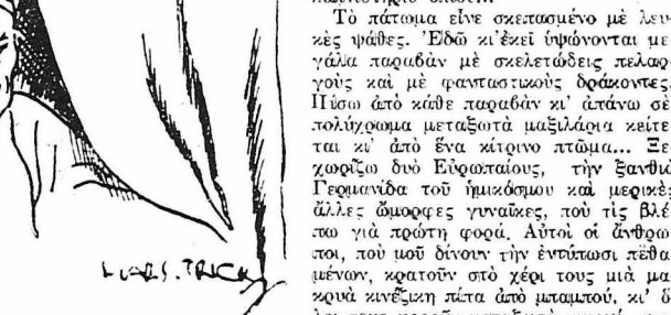
Κινέζος ύπάλληλος καπνιστηρίου όπιου.