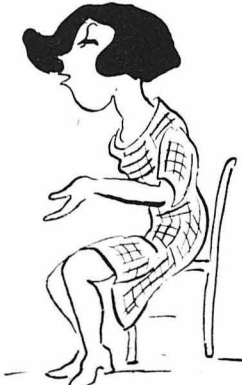
—'Η τρίτη τ'άχει μ' ένα δικηγόρο!...