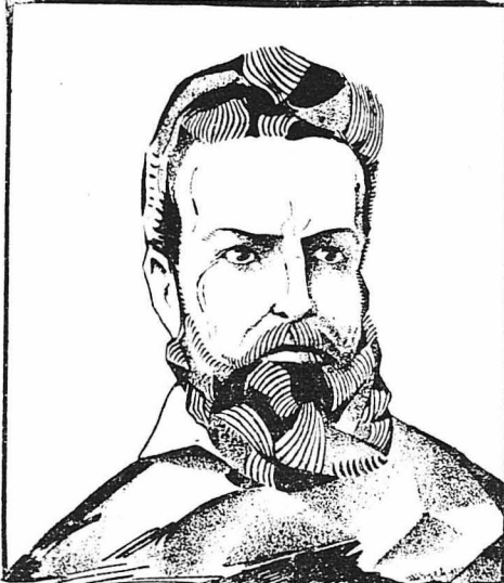
Ο Χρήστος Μπότεβ

Ύστερ' από ένα μικρό και κομιστικό ταξέδι, ο Χρήστος Μπότεβ έμπαινε στη Βουλγαρία, επί κεφαλής των παλληκάρων του. Διέταξε τότε τους άνθρώπους του νά φραδούνε τες έθνικες τους ένδημιασίδες