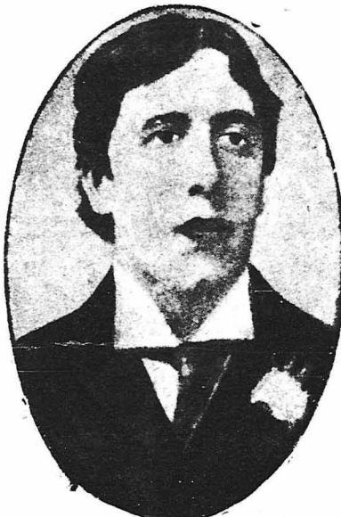
Ό Όσκαρ Ουάιλντ

Ό φίλος του Ουάιλντ μ' έκατηγόρησαν ότι εγώ ήμουν ή αιτία τής καταστροφής του. Όλοι τους, ώστόσο, έπρεπε να είχαν καταλάβει ότι ο μόνος υπεύθυνος για την καταστροφή του Όσκαρ Ουάιλντ ήταν ο Όσκαρ Ουάιλντ ! Δεν θέλω μάλιστα να κρινώ ότι, έφάσαν ο Ουάιλντ