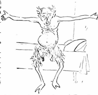
"Άνοιξε την άγκυλιά του ό Σατανάς και την έσφιξε έντός αυτής !..."