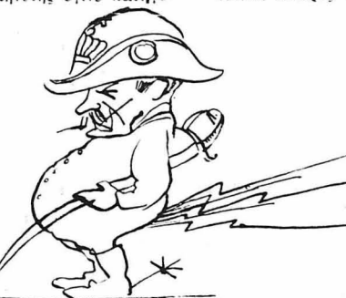
Κι' ό Κερανώσ ;

—Εγώ ξέφο πολλές που είναι φριδιά κι' έχουν άπάνω τους...δέμα γυνακός ! "Ο πάτερ Ματθίωσ σταμάτησε για μιá στιγμή κι' έπειτα συνέχισε : —"Άμαρτάνει άζώμα και κείνος που κρατάει πάνω του για μάγνια ιταροσφι, κεραινό ή προσκαύρα... —Τι προσκαύρα είν' αυτή ; —Τη μύσκα που έχουν μερικά παιδιά όταν γεννώνται : —Προσκαύδες όλοι... φέρουν σήμερα, πάτερ μου, Μερωκοί μάλισα και από διώ και τρείς μαζί, κατά τις περιστάσεις και τά πρόσφατα που συναντούν... ΣΤΟ ΠΡΟΣΕΧΕΣ : "Η συνέχεται.