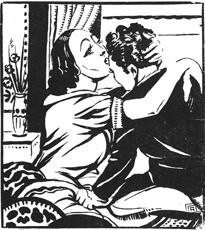
Και αυτή ή φορά κατόρθωσε να του πάρη τό κεφάλι μέσα στα χέρια και τό φίλησε παράφορα στό μέτωπο.