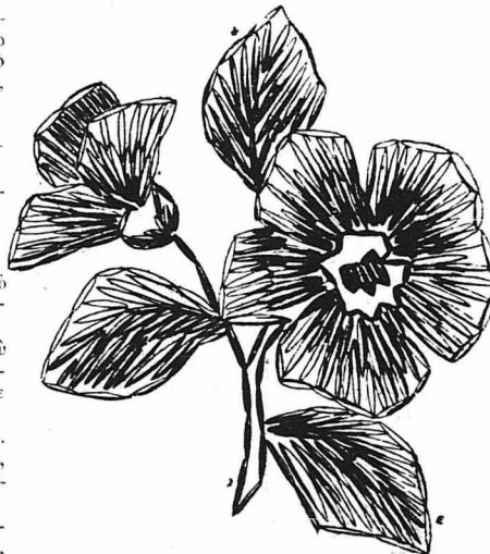
Κεντητό λουλούδι από μαλλί η μεταξύ για γαρι-τόδρα μπουτονιέρας.

τε ως πιο αποτελεσματικό, τό μίγμα με την ζάχαρη και τό λεμόνι, για τό όποιο έχω γράψει λεπτομερώς σε προηγουμένο φύλλο του «Μπουκέτου». Γιατί η αποψήλωσις με την ελαφρότητα είνε όδυνησῆ λιγάκι.