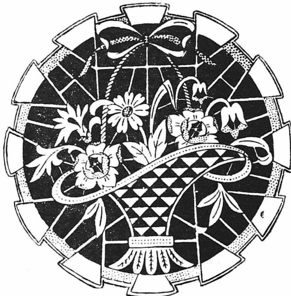
Μαξιλάρι για ντιβάνι, με κέντημα κορτό, και με ντεκούπ, έπα-νο σε σκούρο βελούδο.

ΑΓΟΡΑΖΟΥΜΕ σε άπολύτως ικανοποιητικώς τιμὰς παλαιά διά-φορα βιβλία, παντός είδους και πάσης γλώσσας, καθώς και δλό-κληρες βιβλιοθήκες. Γράψατε : «Μπουκέτο», Λένα 7, Αθήνας.