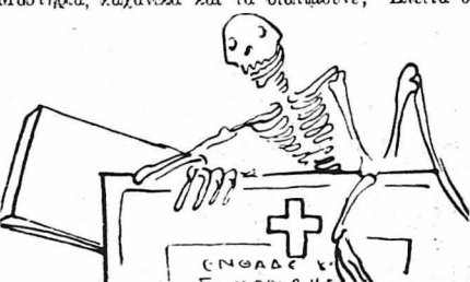
Θ' άνοιξουν τά μηνύματα και θά βγοϋνε τά όστα τών τεθνεώτων!...

Εκτός των άνωτέρω βιβλίων, έχου έκδοθί κατά τό τελευταίον έτος και σειρά άλλων παρομοίων, πράγμα τό όποιον δείχνει την οικονομική εύφροστία της μονής, ή άν ώλι της μονής, τουλάχιστον του ήγουμενου. Ερωτήματα να ερωτήσω: — Και από πού βρισκονται τά χρήματα και όλες αυτές τίς έκδόσεις; — 'Ο Θεός! μου άπάντησαν. — Τι κάνει ο Θεός; — Τά πέματα. Σκέπτηκα ότι ο Θεός βεβαιώς δίνει τον νοΐν στον άνθρωπο, διά του όποιου νοός εξερισκονται τά μέσα άποκτήσεως χρημάτων. Άλλά άποστολήν χρημάτων άτ' εΐθεας από τον ούρανό πρώτη φορά άκουγα. — Και πώς τά στέλνει ο Θεός; ορώτρα. — Δά της θείας του δυνάμεως. Έβαινα για λίγες στιγμές σκεπτόμενος. Έξαφνα όμως ο ήγούμενος με συνέφερε. — Ξέρεις, μου λέει, πότε ήρθε ο Άντίχριστος επί της γής; — Ξέρω ότι πολλοί άντίχριστοι ένεφανίσθησαν και εμφανίζονται και ύπαόχουν πάντοτε επί της γής! — 'Όχι, μου άπαντά. Εινε τώρα 15 χρόνα άπου εγεννήθη. Και από τότε ο «Φραγκάταξ» διέτηρεσε τά άγια Μυστήρια. — Ποός Φραγκάταξ; — Ο Κακόστομος, ο ψευτοθεοσπότης Άθηνών (έννοούσε τον Μητροπολίτη). Διετήρησαν την βάπτισιν, τον γάμον, τό ευχέλαιον, 50 δραχμάς ή βάπτισις, 100 ο γάμος, 20 τό ευχέλαιον. Τι εινε τά άγια Μυστήρια, λαχανικά και τά διατιμούνε; Έπειτα οι σχισματικοί Ιερωμένοι κάνουν σήμερα και άλλας άνομίας. Κόβουν τά γένεια τους και τά μουστάκια τους. 'Ο Θεός όμως δέν μās εινε να γίνουμε μασκαράδες κόβοντας τά μουστάκια μας. Αυτό εινε μόδα φράγκικη, μόδα καταραμένη. Ούτε τό σταυρό τους σήμερα οι έπίσκοποι δέν ξέρουν να κάνουν. Κιτάξτε τους όμα