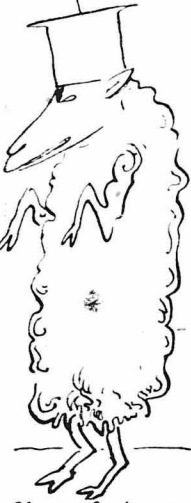
Οι προβατόσχημοι νεομερολογίται!...

Νά και ένα άλλο Πατριαρχικό και Συνοδικό Συγγίλιο, τό όποιον έξεδόθη επί Πατριάρχου Κωνσταντινουπόλεως 'Ιερεμίου, 'Αλεξανδρείας Συμβέστρον και 'Ιεροσολύμων Συνοριου, αρχιερός για την «καινοσημιά» της Πατρικής εκκλησίας, νά ακολουθήση τό Γρηγοριανό ήμερολόγιο. «ΑΠΟΦΑΣΙΣ Ι. ΣΥΝΟΔΟΥ, ΜΕΤ' ΕΠΙΤΙΜΙΟΥ. «Όποιος δέν ακολουθεί τά έθιμα της εκκλησίας, ως και αι επί τ' Άγιοι Οικ. Σύνοδοι έθέμισαν και τό 'Αγιον Πάσχα και Μηνολόγον καλώς ενομοθέτησαν και ακολουθώμεν και θέλει νά ακολουθήη τό Γρηγοριανόν Παρχάλιον και Μ η ν ο λ ό γ ο ν του Πάπα και άθθεν άστρονόμων και εναντιώνεται εις όλα αυτά και θέλει νά τά ανατρέψη και νά τά χαλάση, άς έχει τό ά ν α θ ε μ ε α ε ζω της του Χριστού εκκλησίας και της των πιστων όμνήσεως, άς είνε. ΣΤΟ ΠΡΟΣΕΧΕΣ: 'Η συνέχεια.