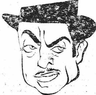
'Ο Ουίλλιαμ Πάουελ.