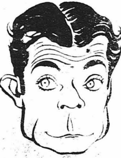
'Ο Τζέο Μπρόουν.

'Η τελευταία λέξη του Ραμόν Νοβάρο είνε ή κριτοική. 'Ο όποιος πρωταγωνίστης της όθνης έχτισε στο Χόλλυγουντ μιιά μικρή βίλλα μ' έναν άπεράντο κήπο και άπερρόνει όλες τίς ώρες τής σχολής του στην περρούκει του κήπου αυτού. Φιτεύει και καλλιεργεί μόνος του τά διάφορα άνθη και φυτά και τό μεγαλύτερό του κοριάρι είνε μιιά όραία κληματαριά, την όποία εκήτεψε κάτω από τό μπαλκόνι του.