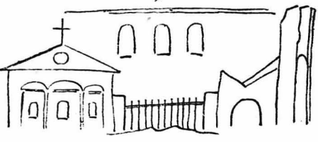
Ο μικρός επί του βουνού ναόςκος τής μονής.

—Συνγάμην, αλλά νομίζω πως Κακόστομος εινε όποιος βρίζει... ΣΤΟ ΠΡΟΣΕΧΕΣ: Ή συνέχεια.