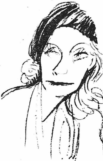
Ἡ Γκρέτα Γκάρμπο. (Σκίτσο τοῦ Μαγιόρ).