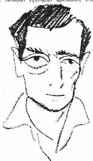
Ὁ Μπάστερ Κῆτον. (Σκίτσο τοῦ Μαγιόρ).