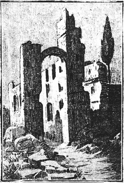
‘Ερείλια παλατιών των βυζαντινών άρχόντων.

(Πινάκ άπό τήν ‘Εκθεσι του διαπρεπούς καλλιτέχρου κ. Γιάν. Ζωγράφου στον «Παρισσό»).