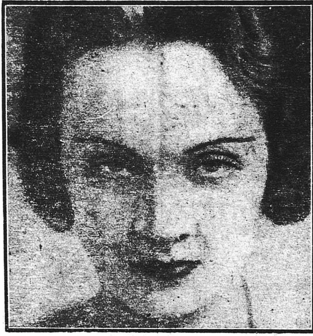
Η Μάρλεν Ντρήτριχ

Θά έπιβλήθη στό τέλος ή χειλεομαντία; Και θά έρθη μία εποστό στόμα του συνομιλητού μας τον χαρακτήρα του, όπως θά τον διαβάσουμε σ' ένα ανοιχτό βιβλίο; Ας τό ελπίσουμε. Γιατί τότε τέλος θά μπορούμε να λυθώ και τό άινιγμα της Τρισκόνας που τό στόμα της τώρα και πεντακόσια χρόνια, τό λεπτό χαμόγυλο των χειλιών της κρύβει ένα μυστήριο.