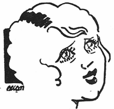
Ἡ περὶσσημ Γαλλίς ἠθοποιὸς τοῦ θεάτρου καὶ τοῦ κινηματογράφου Οὐγκῆτ Ντυρλό.