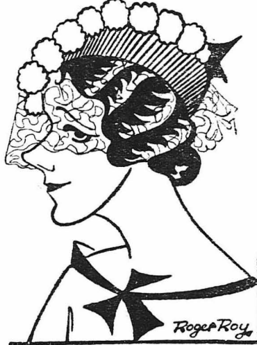
Ἡ Γαλλίς βεντέττα Ἰρὲν Ντιόν, στὸ νῆο τῆς φιλμ «Μπᾶν — Στρέη».

—'Η γερμανικὴ κινηματογραφικῇ παραγωγῇ διατρέχει τώρα περὶτοια ναρκώσεως. Τὰ στούντιο δὲν γυρίζουν πετὰ φιλμ, ἐπειδὴ δὲν ἔχρουν ἂν ἡ χιτρερικῇ λογοκρισία θὰ τὰ ἐγκρίνῃ ἢ ὁ ἀπαγορεύσῃ τὴν προβολὴν τους.