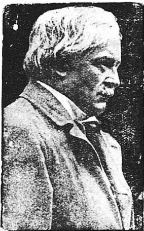
'Ο Λούδ Τζώρτζ