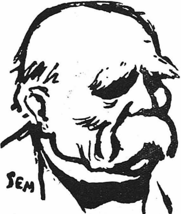
'Ο Γεώργιος Κλεμανσώ