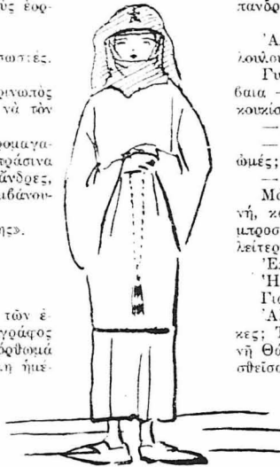
Καλόγηρα της Μονής της «Κακής Θαλάσσης».