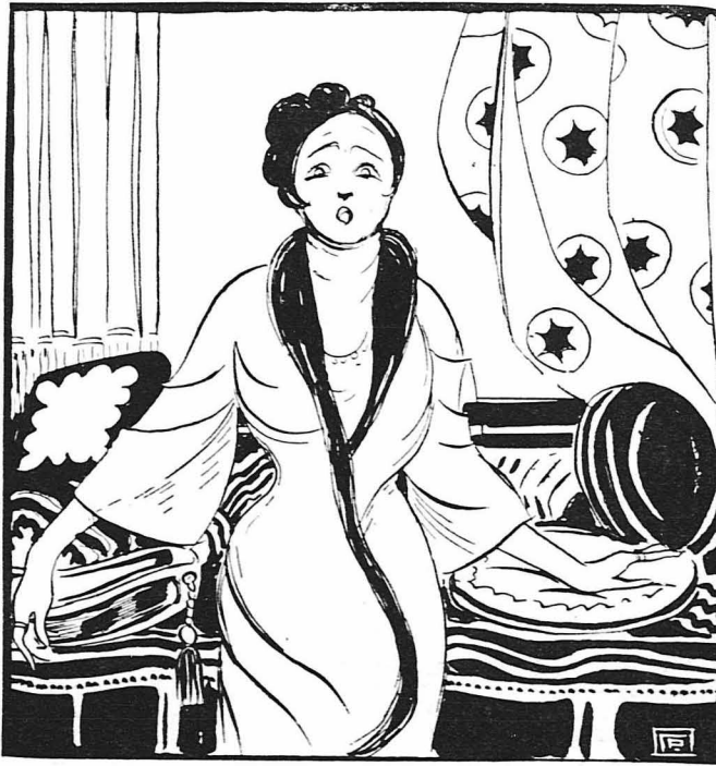
Η στρατηγίνα, άκούοντας τά τελευταία λόγια, σηκώθηκε έπάνω κατάχλωμη...

—Κύριε Ρουλιτακιλ, τού άπάντησε ή Ματρώνα καταβάλλον-