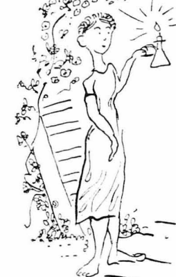
"Όλη άνθη, όλη φως!..."

Ήταν αδύνατον να το πιστέψω ο ένοχοξότατος Κόιτας Τηγανήτας, έπιλοχίας τών ενδόνων, ότι η φοδοπάρεος και σάν φρέσκο μύλο στρογγυλή και δροσερή Μαρούλια, της ζωής του ο σκοπός, και της ψυχής του το πλήρωμα κι' η χαρά, τον άπαιτούσε, φεύγοντα τη νύχτα χωριά από το σπίτι του πατέρα της και πηγαίνοντας σ' ένα χάλιασμα, όπου την περιμένε ο κ. Σπυριγιάννος, γραμματέας της Κοινότητος, πρώτης ύφεστερος στην εκκλησία και δάσκαλος στο χωριό τριτοβάθμιο.