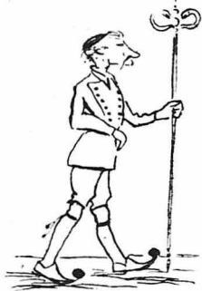
Τό Μήτρο, ένα Ρουμ-λιώτη κουτοπόνηρο.

"Όταν πήγαινε κανένας παπάς για να τον προσκυνήσει, ή να ζητήσει άδεια για τίποτε, τού έλεγε με τη χοντρή φωνή του :