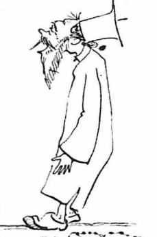
— Πού είνε τó φιλότι-μό σου, αφιλότιμε !