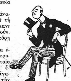
— Πούφ! Πραγματικώς εινε φωτιά και λαύρα...