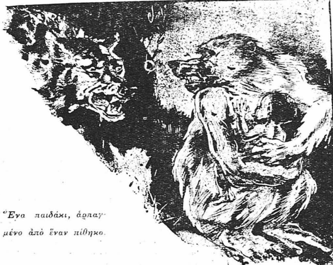
Ένα παιδάκι, άρπαγμένο από έναν πιθήκο.

Υστερα από ένα αιώνα, κι' άκριβώς τ' ό 1661, δύο κνηγοί βοήκων σ' ένα δάσος της Λιθουανίας ένα μικρό παιδί που ζούσε μαζί με