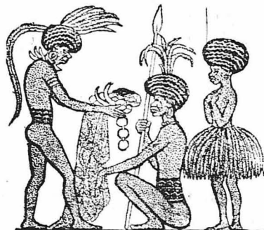
Ἀγορὰ γυναικὸς στὰ νησιά τοῦ Σολομῶντος.