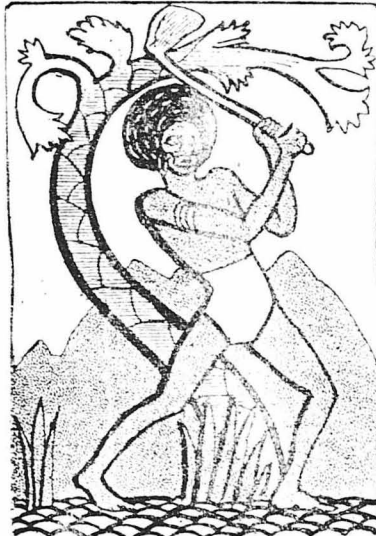
Ὁ ἄγιος πρέπει νά δουλέψῃ σκληρὰ γιὰ ν' ἀποκτήσῃ τὴ γυναίκα του.

Ἀρκετὰ ὅμως μιλῆσαμε γιὰ τοὺς ἰθαγενεὶς τῆς Ὠκεανίας. Ἀς ἐξετάσουμε τώρα τὰ ἔθνη καὶ μερικῶν φυλῶν τῆς Ἀσίας. Οἱ Καλμυκοί,