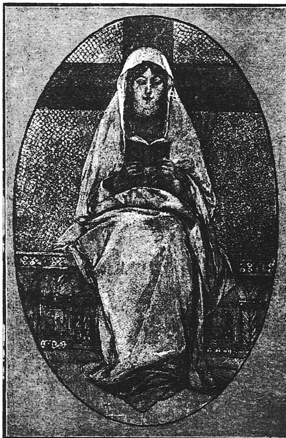
Η ΜΗΤΕΡΑ ΤΟΥ ΧΡΙΣΤΟΥ