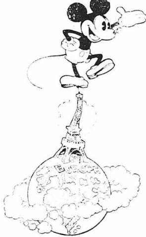
Μίκυ Μάους, ο κυριαρχος του κόσμου ! (Γελοιογραφία ευρωπαϊκού περιοδικού)

— Ο νέος άσπτη του Χόλλυγουντ, ο Τζώρτζ Μπρέντ, θευλείται ότι κάνει αντίραξη στον Κλάρκ Γκείμπλ, όχι εξ αιτίας της τέχνης του, αλλά εξ αιτίας της μεγάλης όμοιότητας που έχει μαζί του. Τελευταία μάλιστα ο Μπρέντ έσχεσε όδες τις φωτογραφίες του, τις όποίες ήθελε να κυκλοφορήσουν ως κάρτ—ποστάλ, μόνον και μόνον έπειδή έμιασε σ' αυτές έξαιρετικά με τον Κλάρκ Γκείμπλ.