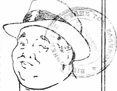
Σκίτσο του περιφημου Γάλλου κωμικού της θόνης Πωλέ.