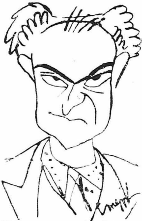
Μιά χαρακτηριστική γελοιογραφία του διασήμου Γερμανού σκηνοθέτου Μπέερχολντ Βιερέλ.

— Νέα επιδημία διαζυγίων στο Χόλλυγουντ. Το κουτσομπολιό μάλιστα σχετικά με την συζυγική διάστασι του ζεύγους Τζόννυ Βαϊσμύλλερ και Μπόμπης Άρσον εξ αιτίας της διαβολικής Λούις Βελές, έβγηκε βόσιμο. Ο Βαϊσμύλλερ άνηγαίκε επίσημως ότι πολύ σύντομα παίρνει το διαζύγιο του από τη σύζυγο του και δεν άρνήθηκε ότι μόλις θρθεθεί ελεύθερος, θα άρραβωνιστεί με την φράια Λούις.