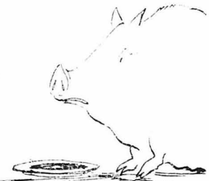
Πάει και ή μαλτέζικη γουρούνα!...