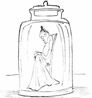
Με μοτιλλιάρσιες κι' εμένα!