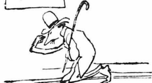
Πώς λοιπόν να μην πιστεύη τόν Θεό, και πώς να μην κάνη τόν σταυρό του;...

ΨΗΦΟΔΕΛΤΙΟΝ ΕΚΛΟΓΗΣ ΒΟΥΛΕΥΤΩΝ † Δουφεκλήρη