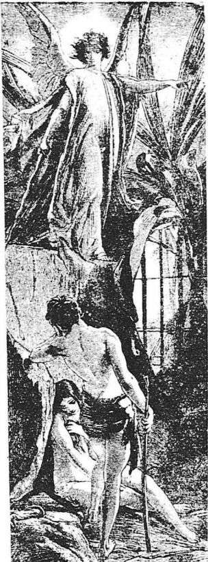
Η έξοικονομασία των Προτοπλάστον απ' τον Παράδεισο.

— Δέν βαρύνεσαι, άγάπη μου! Άρκει πού είμαστε μαζί. Θα τών ξαναφτιάξουμε μόνοι μας τον Παράδεισο, της άπάντης χαμογελώντας ο Άδαμ και κούλησε τά χείλη του στά χείλη της, σ' ένα περσάτεκαμένο φιλά.