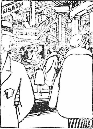
Υψηλεία από είδικους ντυτέκτες, παρακολουθεί άρρωπινα τους πέλατες.

Ο κοινός λωποδύτης και ο κλεπτομανής. Η παράξενη ιστορία μιας πλούσιας Γαλλίδας φοιτήτριας. Πώς έγινε λωποδύτρια ή Σακελίνα Φουρνιέ. Η μυστηριώδης ζωή μιας νεονύμφου. Ο κλεπτομανής γιός του λόρδου Νόρφολκ, κ.τ.λ. κ.τ.λ.