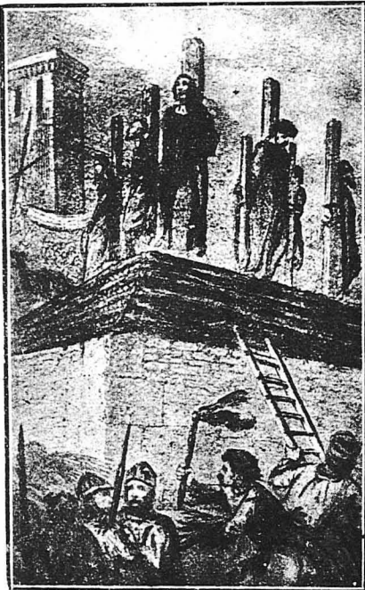
Οι αρετικοί της Καμπανίας.