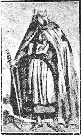
‘Ο ‘Ιακώβος ντε Μολαί.

νο τη «βασιλεία των ουρανών», μα και την επίγειο ζωή, γιατί δεν επιτρέπονταν σε κανένα να έχει σχέσεις μαζί του. ‘Ο άφορισμένος ζούσε ολομόναχος, σαν λεπρός, προσκλιόντας διαρκώς τη φρονη και τόν άποτροπισμό του κόσμου, ώσπου πέθανε μια μέρα άπ’ τόν καταρτηγμό και τις στερήσεις.