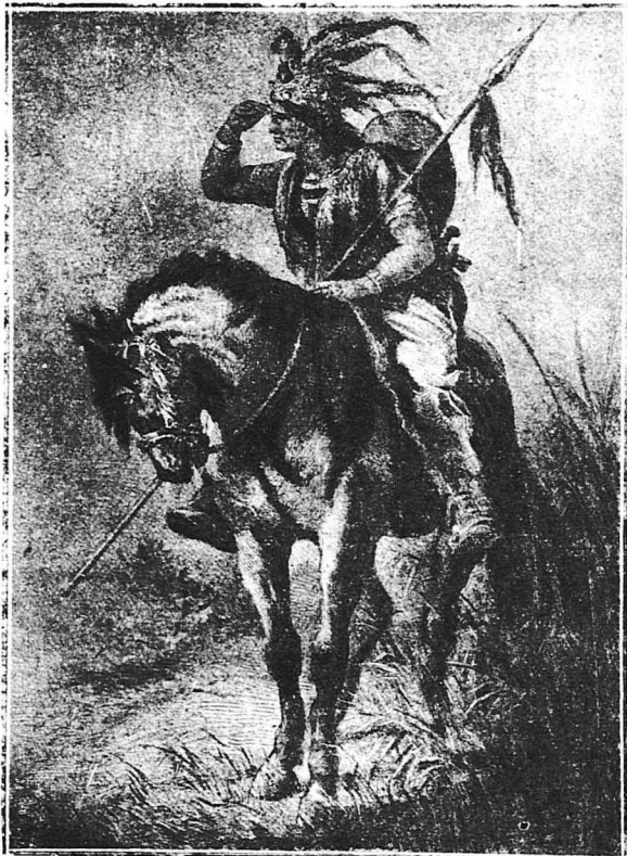
Ο Αίγαργος κίτταζε γύρω του προσεκτικά...