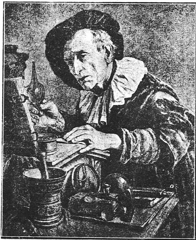
Ό Άλχημιστής (Πινάκ του Λεόν Μπρινέ)