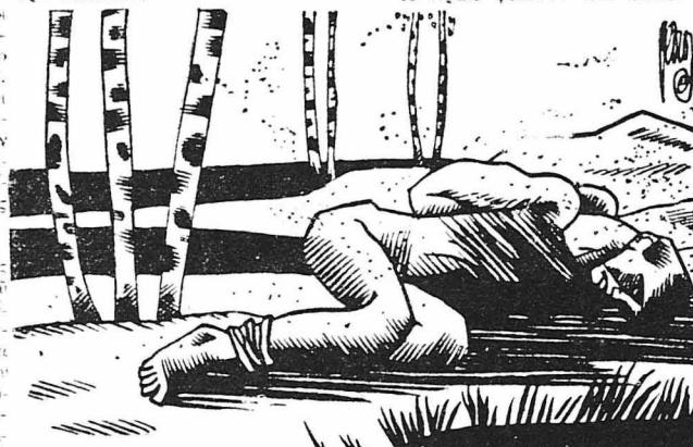
Χιλιάδες κοινούτλια έπεσαν έπάνω στο γυμνό σώμα τού γασοκλήμωνος...