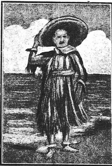
Ο τελευταίος κάτοικος της νήσου Πίτκαϊον

Ο πλοίαρχος Κόρνουμ παρέλαβε τον άλλον κάτοικο του νησιού με την ούλη, έπάνω στό πλοίο του, όπου ο γιατρός του πληρώματος τον περιέβαλε με άπειρες περιποιήσεις. Άλλά ή έξάνηλιση του ήταν τόσο, ώστε έπειτα από λίγες ήμέρες πέθανε, χωρίς ο πλοίαρχος Κόρνουμ να κατορθώσει να του άποσπάσει λέξη.