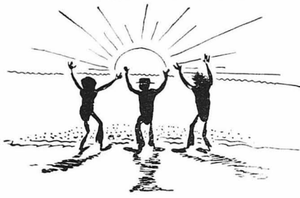
— Θα έφημερώση και για μάς !

Άλλά κάτοιο θρηνητικό μουχομούριμα, σαν μακρινό ληπτερό τραγοδι, ή ψαλωμίδες του παπά, τους έκοψε την δραξι στο σόμα.