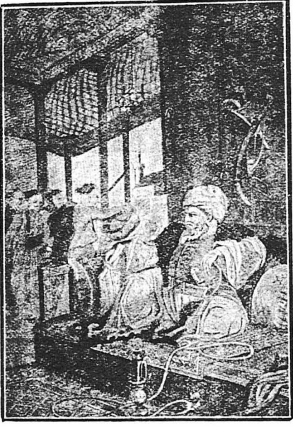
'Ο 'Αλή πασάς στο σεργάι του.

Μεταχειρίστρας δέ ο 'Αλής πλείστους όσους στην έπηρεσία αυτή, όχι μόνον άνδρες, αλλά και γυναίκες. Μιά απ' αυτές ύπήρξε κι' ή Φροσύνη. 'Ο 'Αλής είχε διακρίνει στη γυναίκα έκείνη, όχι μόνον ύπέροχα σωματικά, αλλά και πνευματικά χαρίσματα, και σκέφτηκε πως μπορούσε να του προσφέρει πολλά. 'Η δέ γλωσσολάτριά της, καθώς γράφαινε, της είχε δημιουργήσει πολλές σχέσεις με τους Ξένους, που παρέμεναν στα Γιάννενα και που σύναζαν στο σπίτι της.