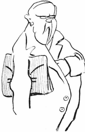
Ἀπευθύνθηκαν σὲ ἀνθρώπους πού δημιουργήθηκαν ἀπ' τὴν Ἀκρόπολις μεγάλοι...

Ἐγγε τὸ λοιπόν!... Πήγαυε καί ἐρευνήθη εἰς τὸ ὑπερτετρακοῦδρον μισθό σου, ἀνεφάνησε ὁ Γαβριηλίδης ἀνακουφισθεῖς, ἀράξαζε τὴ