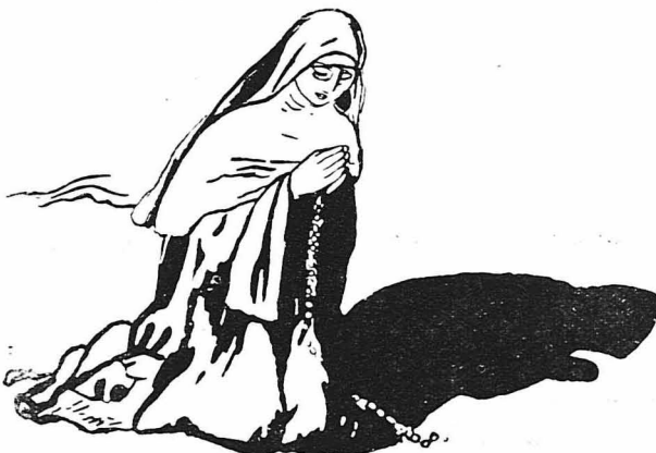
Ἡ Πρίσκα γονάτισε καὶ ἄρχισε νὰ προσεύχεται...

Καὶ ἡ μεγάλη δούκισσα τῆς ἀπάντησε... Μὰ καλύτερα θὰ ἦταν νὰ σκοποῦσε.