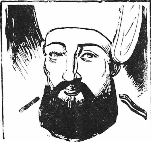
Ὁ Κιοσὲ Μεχμέτ.

Ἡ διάταξι τῆς ἀμύνης εἶχε ὄς ἐξῆς κατὰ τὴν ἐπιτόπια ἐρεῖνα τοῦ Γ. Κοῦμου: Ὁ Ἰωάννης Δουβουνιώτης κατέλαβε τὴν πρὸς δυτικὰς γέφυρα τοῦ Φραντζῆ, οἱ ὑπαρχηγγοὶ τοῦ Διάκου Καλιόβας καὶ Μπακογιάννης καὶ ὁ Ἀναγνώστης Καλιόβας τῆς γέφυρας τῆς Ἀλαμάνας, ὁ δὲ Διάκος τὴν ἀντικρὴ τῆς γεφυρας κλειτὸν τοῦ Καλιόβου, κοντὰ στοὺς πρῶτοδας αὐτοῦ καὶ ἄνω μερὶ Λαμιάστας καὶ Χαλκιωμάτας, κάτω δὲ μερὶ τῶν πλησίον τῆς Ἀλαμάνας λόφους. ΠΟΥΡΙΑ καλοῦμενον. Ὁ Πανουριάς τὴν πρὸς τὰ νοτιοανατολικὰ τὸν Μουσταφάμη Χαλκιωμάτων, πλησίον τῆς ὁδοῦ τῆς ἀγοῦσης εἰς ΓΡΑΒΙΑΝ καὶ ὁ Κοινὰς Τράκας τὸ Μουσταφάμη. Κ' ὁ μὲν Δουβουνιώτης παρῆταξε 400 ἄνδρας, ὁ Διάκος 500, ὁ Πανουριάς 600 κ' ὁ Κοινὰς Τράκας 250 ἦτοι συνολικῶς ὁ Ἑλληνας παρῆταξεν χιλίους ἐπτακοσίους πενήτη στρατιώτας. Ἀλλ' ἀπ' αὐτοὺς οἱ περισσότεροι ἦσαν ἀντιπροβόλοιμοι καὶ κακῶς ὀπλισμένοι. Μόνον τριακοσίους μποροῦσε νὰ θεωρήσῃ κατεῖς ὅς τὴν πραγματικὴ δύναμι, πρὸς παρῆταξεν οἱ Ἕλληνες ἐπὶ μέρῃ τῆς Ἀλαμάνας. Ἀπέναντι τῶν ἀσθενῶν αὐτῶν δυνάμεων ὁ Τούρκος εἶχαν ὀχτὸ χιλιάδες πεζοὺς καὶ ὀτακοσίους ἱππεῖς. Ὄρηστον το δὲ οὐσιαστικῶς ἀπὸ τὸν Ὀμεῖρ Βρυώνη, ἔνα ἀπὸ τοὺς πῶς πεπειραμένους, δραστηριοὺς καὶ πεισιμονας στρατηγγοὺς τῆς Ἀλβανίας.