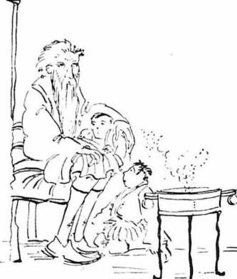
Θυμήθηκε τις διηγήσεις του παππού του, κοντά στο μαγκάλι...

Και μέσα σε πρόσκαπα και πράγματα, πολύχρομα, που ξεπετιόντουσαν μαγκαλά, αναθεϊνόντουσαν και τὰ πονηρά της εποχής δαιμόνια, τὰ δακτα και τὰ κακά, που πάντοτε τήν παθαίνουν ή από έξουπνάδα εκείνων που πήγανε νά βλάψουνε, ή από επέμβαση επίκαιρη της Θεας προνοίας.