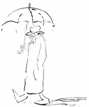
'Ο γιατρός, ο άσπλαχνος και στριμμένος...

πόρο νά περάση... Τὸ κακόμοιρο τὸ άλογο, με δυό ανθρώπους φορτωμένο, πολεμούσε νά νικήση τὸ νερό τή δύναμη... Φυσομανούσε χωμένο ός τὸ λαμό. 'Ο παππούς σας τὸ βάσταγε γερά, προσεχτικά τὰ γκέμα ! Γιά μιá στιγμὴ όμως, τὸ άλογο, σάν νά έφούσκιασε, έγούρλωσε τὰ μάτια του, βοιτηχτηκε πὸ μέσα στο νερό και τὸ ποτάμι έτρησε τόν παππού σας ός τή μέση.