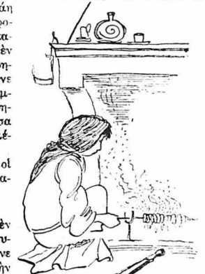
'Η κακόμοιρα ή γυναίκα του έγύριζε τὸ «σουφιμιό».

Πουδὸ τὸ ειπε αυτό ; 'Οχι δέν φύγανε. Μείνανε έδώ για νά μᾶς τυραννούνε !... Μόνο π' άλλάξανε μορφή. Χώσανε σε παντελιόνα τήν σφά τους, κρύψανε τὰ κατοικαδόρα τους, ξυρίσανε τὰ τραγογένεια τους, φορέσανε κολλάρο και σακκάκι