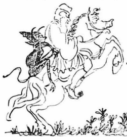
Καθώς περνούσε μία νύχτα καβάλλα ο πάππος σας από τὸ δάσος...

— Φεύγουνε, πατέρα, σήμερα οι Καλλικάντζαροι ; Ρώτησε το μικρό παιδί, σάν ξηφυε ο παππας, σκορπίζοντας μαζί με τή μυρωδιά του θυμιάματος και του δεντρολίβανου και σταλαγματιές άγιασμένου ύδατος, που ήταν σάν βροχή δροσιάς και ήσυχίας πλέον των καλών νοικοκυράδων και καντερό νερό ζεματισμού γιά τους καθυστερησαντας Καλλικαντζάρους... 'Εν 'Ιορδάνη βαπτιζομένου σου,