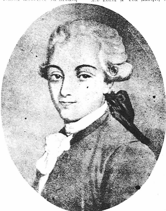
Ό ποιητής Ζιλμπέρ.