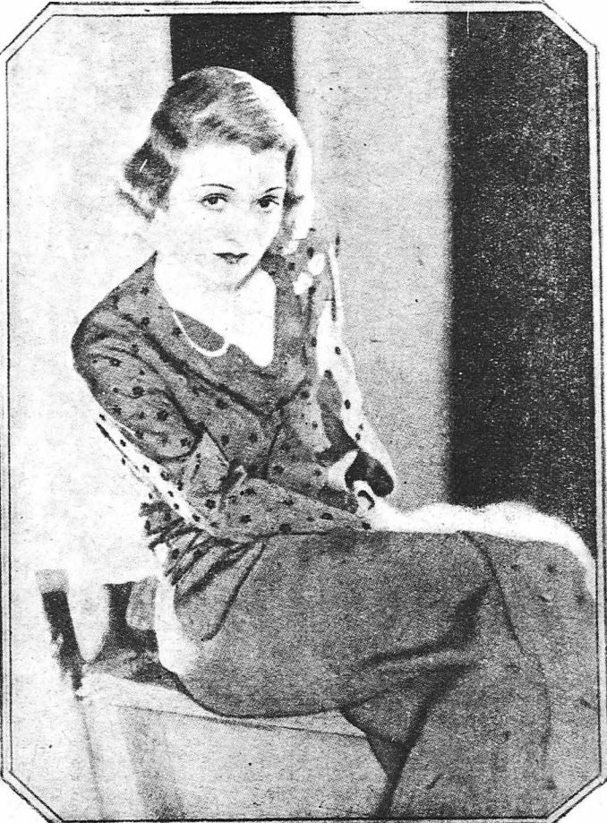
'Η Κόνσταντ Μπέννετ, της όποιας τά χείλη έχουν θερμοκρασία σέξ-άππηλ άνω των 50 βαθμών!

Αυτό πρέπει να σταματήση. Πρέπει δηλαδή να μάθουν ή γυναίκες, να μακρύνονται όχι κατά τον ίδιο τρόπο όλες, όχι όπως μακρύνονται διάφοροι άστέρες και όπως άπαται ή μόδα, αλλά σύμφωνα με τό σχήμα των χελιών τους.