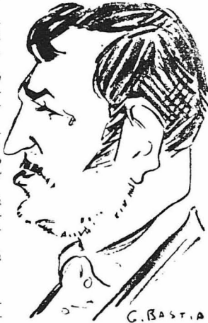
Σκίτσο του μεγάλου Γάλλου ηθοποιού του κινηματογράφου Σαρλ Βανέλ.

νή, γεμάτος επιδέσιμος. Όστόσο έπαιξε ως την τελευταία στιγμή, παρά τούς φρικτούς πόνους του.