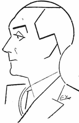
Ένα σκίτσο του περιφήμου Γάλλου «ξέν-ποριμιέ» της θόδης Αντρέ Ροάν

Ο γνωστότατος Γάλλος ηθοποιός Πιερ Μπλανσώ δέχτηκε τελευταία την επίσκεψη ενός νεαρού δημοσιογράφου, που ήθελε, καλά και σώνει, να του πάρη συνέντευξη.