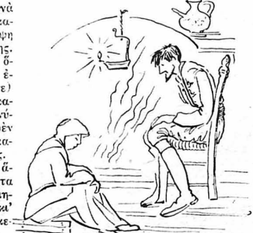
Μά αν πέρασαν τ' Χριστούγεννα, ησυχιά κι' άπραγούδιστα...