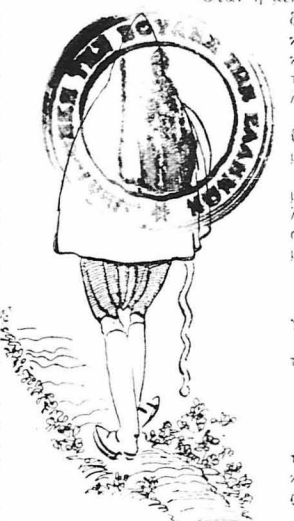
Και κίνησε πίζος...

— Μωρέ, εδώ τρώνε κι’ οι πεθαμένοι!... ΣΤΑΜ. ΣΤΑΜ.