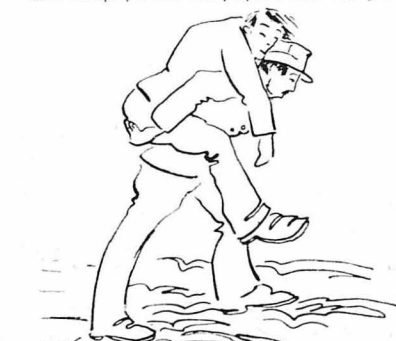
Τόν πήρε στόν όμο του και τόν έσωσε...

Πλακοστρωμένο τ' ο δάπεδο. "Πως μεγάλες πλάκες, που σκεπάζανε τ' ο πρό αιώ-