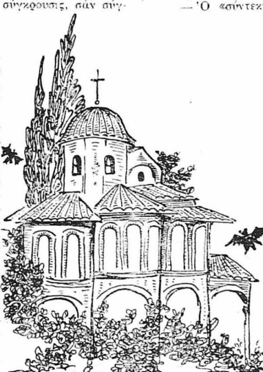
Στό μοναστήρι τής άγιας Φωτεινής