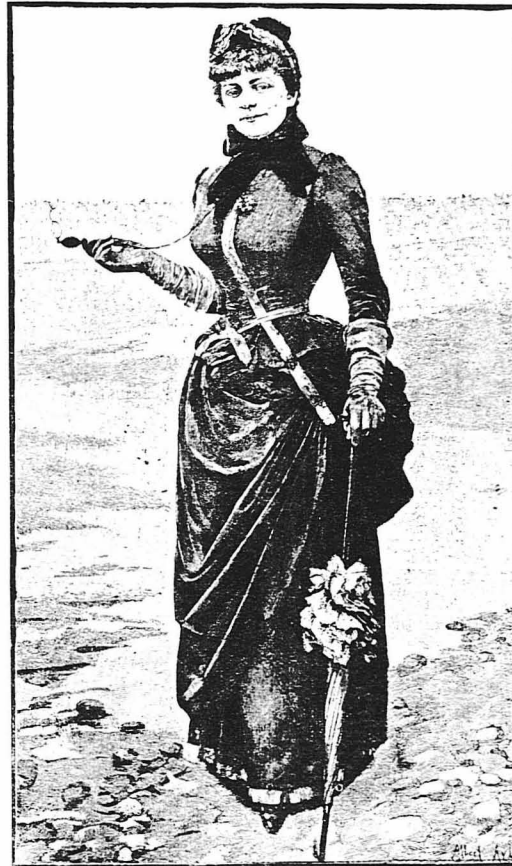
Ἡ πρό μηνῶν ἀποθανοῦσα διάσημος καὶ πολυγραφεῖστὴ Γαλλίς μυθιστοριογράφος Ζὺλ