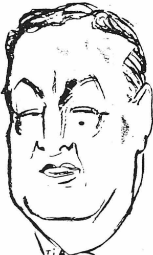
Ο μεγάλος Γάλλος δραματικός ήθοποιος Χάρου Μπάρν, ο οποίος έχει δημιουργήσει μερικούς από τους πιο δυνατούς δραματικούς ρόλους του κινηματογράφου.

— Ένα φοβερό σκάνδαλο συνετάραξε πριν από λίγες μέρες το Χόλλυγουντ: Η Κλάρα Μπάρν και η Θέλια Τόντ, η δυο μεγάλες αντίζηλες της κινηματογραφουπόλευσ... ήρθαν στα χέρια!