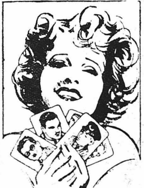
Η Κλάρα Μπάρν και μερικοί από τούς αναριθμητους θαυμαστές της.