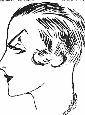
Ένα χαρακτηριστικό σκίτσο της δημοφιλούς βεντέτας Γκάμπυ Μορλάι.