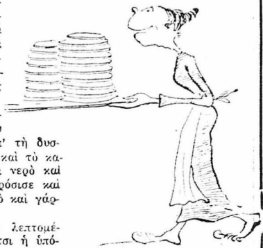
Και τού πουλιού τó γάλα θά σου στείλη με την ύπρητέρια.