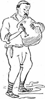
Είχε φύγει κι' ο τελευταίος καλαντιστής.

δέν έχει. Άν δέν τó γράψης, δέν βγαίνεις από δω. Σ' έχουμε κλειδωμένο. Άν δέν παραδώσης τó διήγημα, δέν θά βγής από δω μέσα! Άν πενιάσης, ο κήρ Θόδωρος εν' έδώ κοντά, Είδοποίησε να σου φέρη δτι θές. Και τού πουλιού τó γάλα άν ζητήσης, θά σου τó στείλη με την ύπρητέρια.